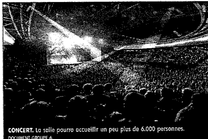
CONCERT. La salle pourra accueillir un peu plus de 6.000 personnes.

Le bâtiment sera doté d'une toiture végétalisée, et d'un belvédère avec vue sur la cathédrale. Il sera situé à quelques pas de la plate-forme multimodale, qui accueillera