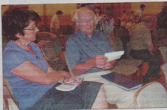
Chartres, mardi. Le projet pôle gare suscite bien des interrogations parmi les habitants.

« Il est fortement à craindre que la concentration d'un tel équipement de 5 000 à 6 000 places en plein centre-ville de Chartres occasionne des bouchons importants lors de l'accès à des manifestations dès lors que les entrées et sorties des véhicules devront inévitablement converger vers le pont de Mainvilliers, c'est-à-dire un entonnoir ! D'autant que